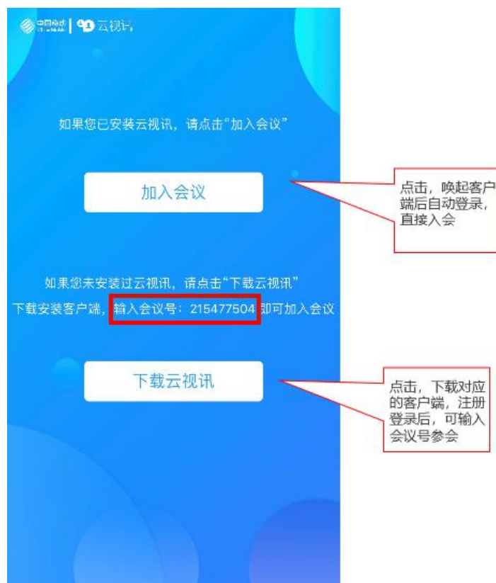
被分享的参会链接页面